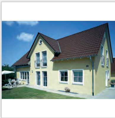
CREATON FUTURA , kolor „FINESSE” brązowa glazurowana.