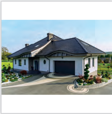
CREATON OPTIMA , kolor „FINESSE” czarna glazurowana.