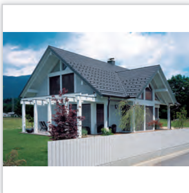
CREATON PROFIL , kolor „NUANCE” czarna angobowana.