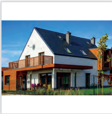
CREATON DOMINO , kolor „FINESSE” w kolorze łupka glazurowana.