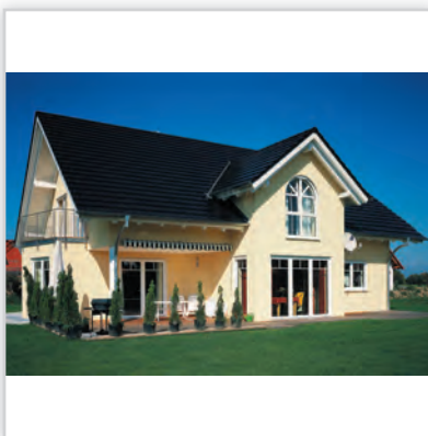
CREATON DOMINO , kolor „FINESSE” czarna glazurowana.