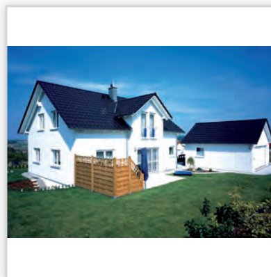
CREATON MAGNUM , kolor „NUANCE” czarna angobowana.